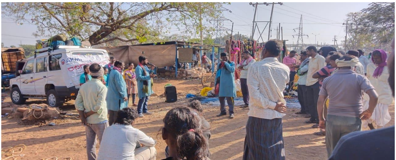
Street Play @ Kerur, Badami Tq, Bagalkot on 10.01.2023