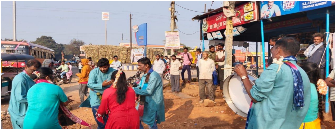
Street Play @ Gaddankeri cross, Bagalkot on 05.01.2023