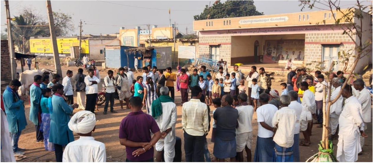
Street Play @ Konkanakoppa, Badami, Bagalkot on 13.01.2023