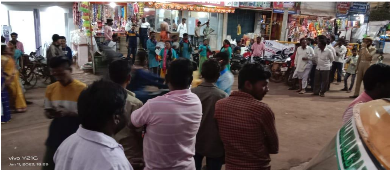
Street Play @ Banashankari Temple, Bagalkot on 11.01.2023