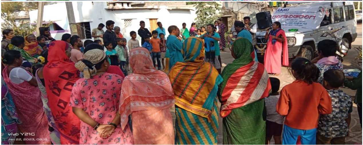
Street Play @ S.M. Krishna Nagar, Gadag on 22.01.2023