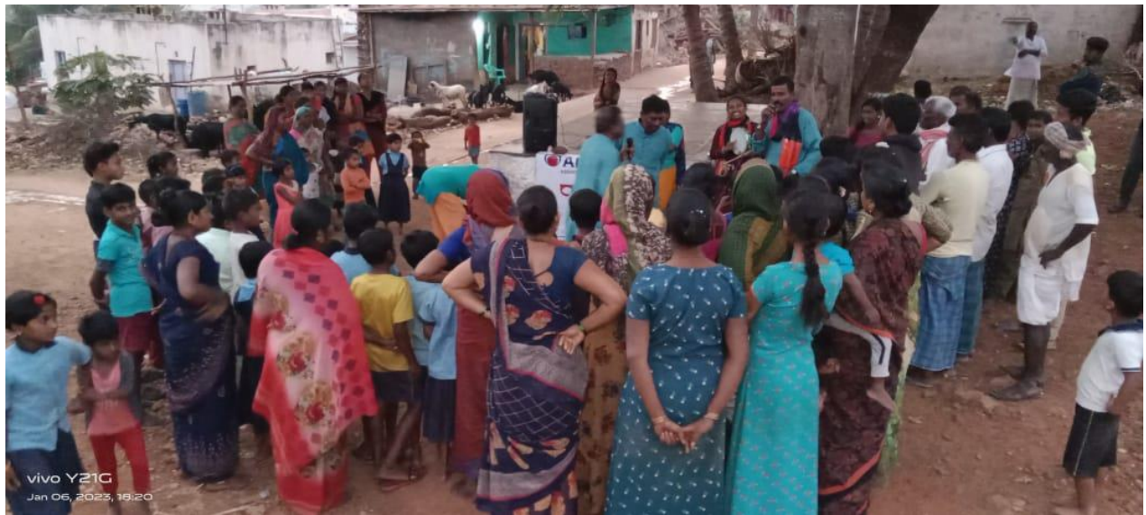
Street Play @ Tulasigeri, Bagalkot on 06.01.2023