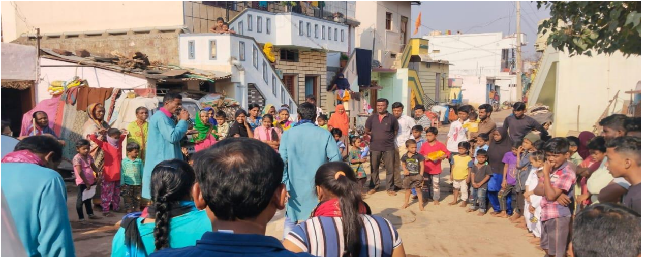
Street Play @ Ambedkar circle, Badami, Bagalkot on 13.01.2023