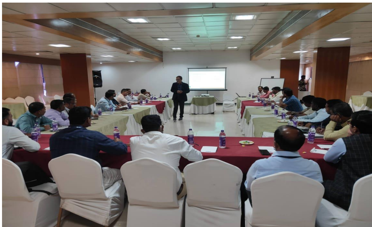
Audit & Risk Management Workshop @JP Cordial Hotel, Bengaluru on 13.01.2023