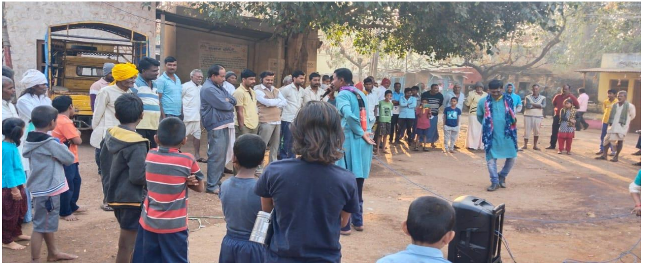
Street Play @ Katageri, Badami, Tq, Bagalkote on 14-01-2023