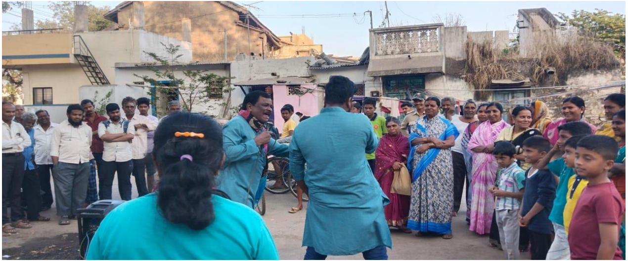
Street Play @ Vakkalageri, Gadag on 18-01-202