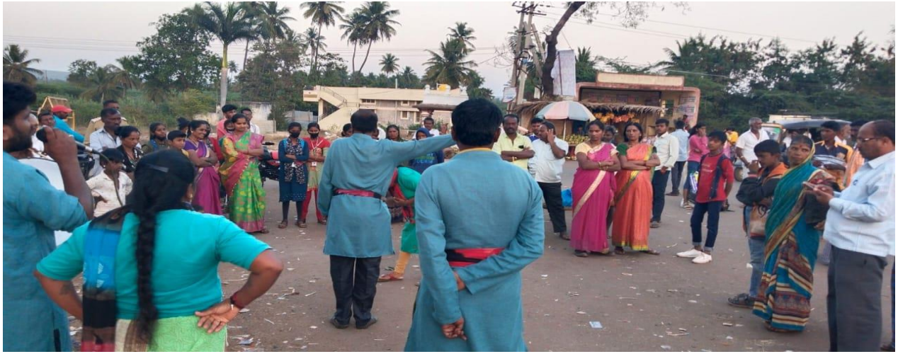
Street Play @ Banashankari, Badami Tq, Bagalkot on 11.01.2023