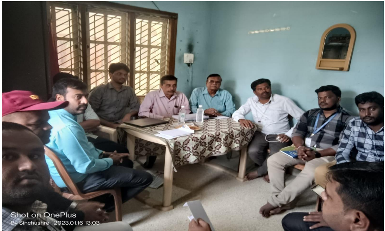
AKMI Preparatory meeting with all MFI's in Mandya Dist. on 16.02.2023