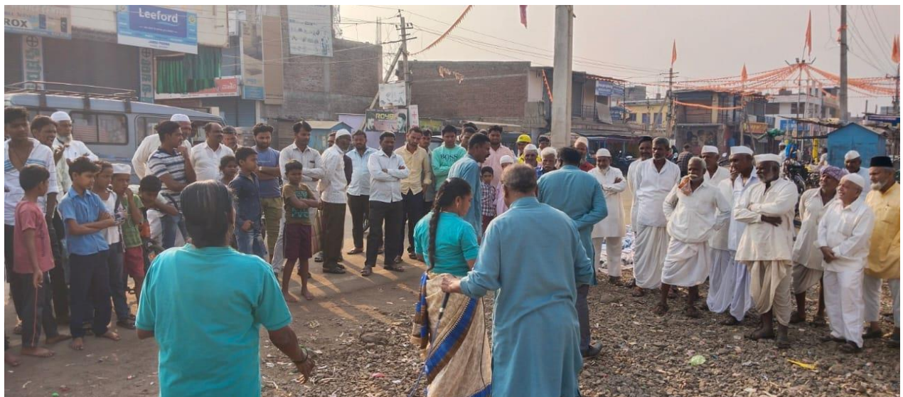
Street Play @ Kolar, Bilagi Tq, Bagalkot on 03.01.2023