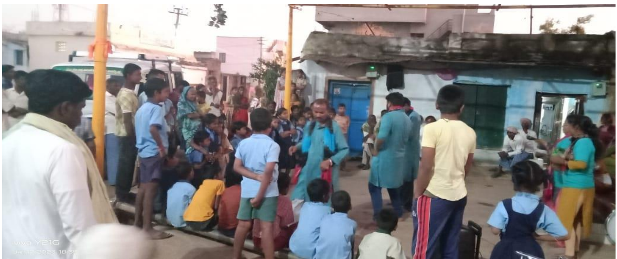
Street Play @ Ambedkar Nagara, Gadag on 17.01.2023