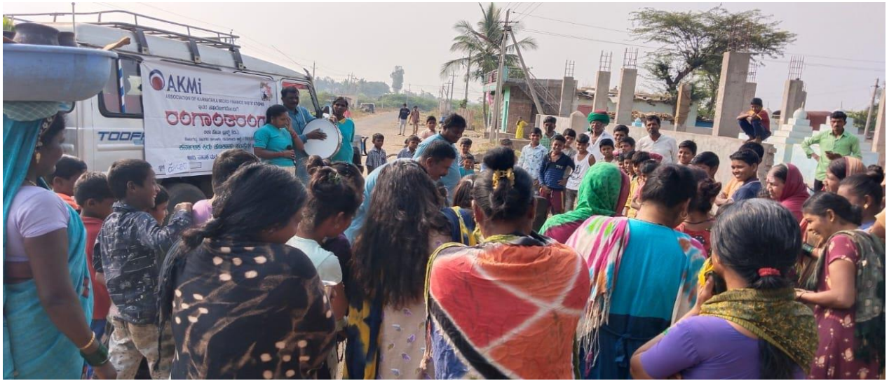
Street play @ Ambedkar Nagar, Bagalkot on 03.01.2023