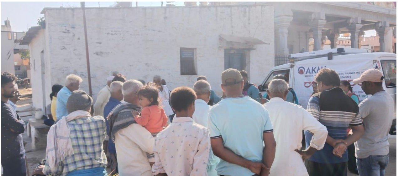
Street Play @ Asundi Patel beedi, Gadag on 19-01-2023