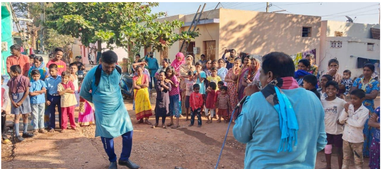
Street Play @ Vajpayee Badavane, Bagalkot on 09.01.2023