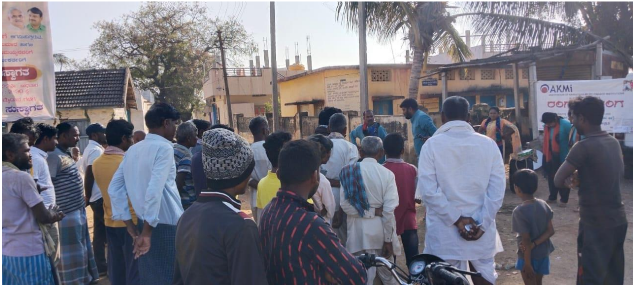
Street Play @ Kadampur, Gadag on 28.01.2023