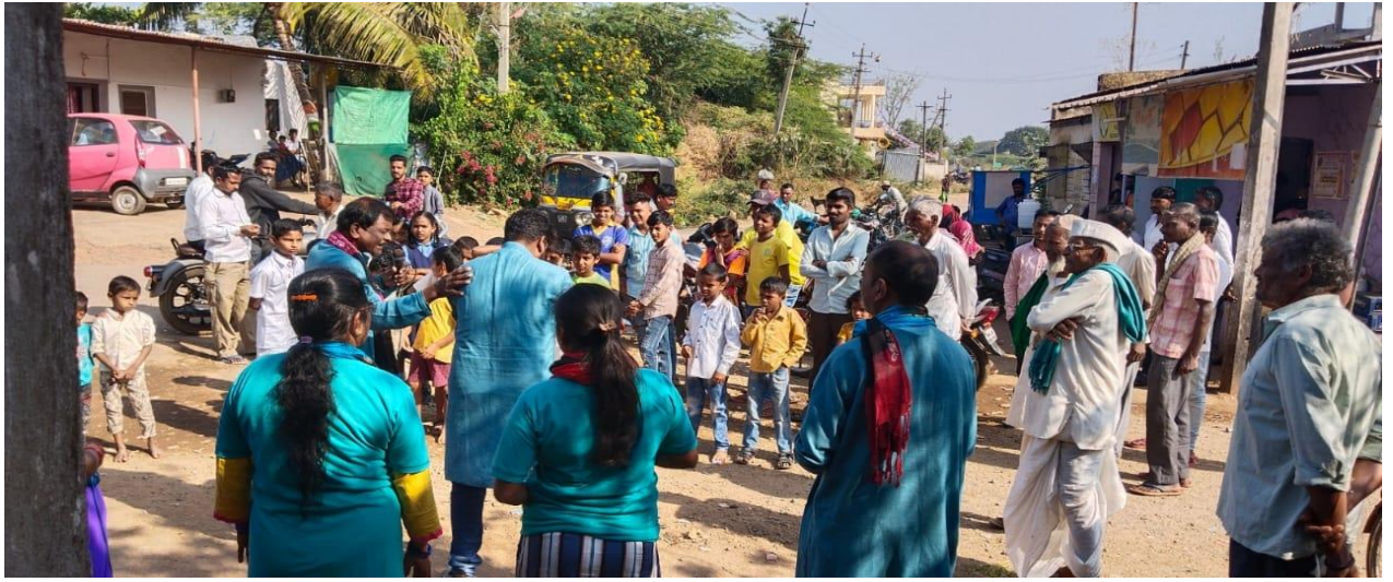
Street Play @ Kalasapura, Gadag on 26.01.2023