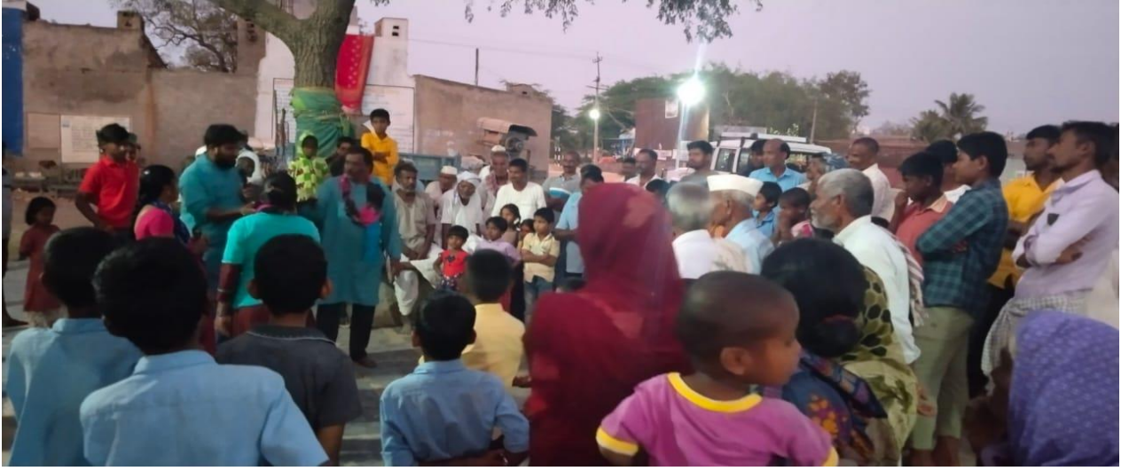
Street Play @ Hoyilagola, Gadag on 24.01.2023