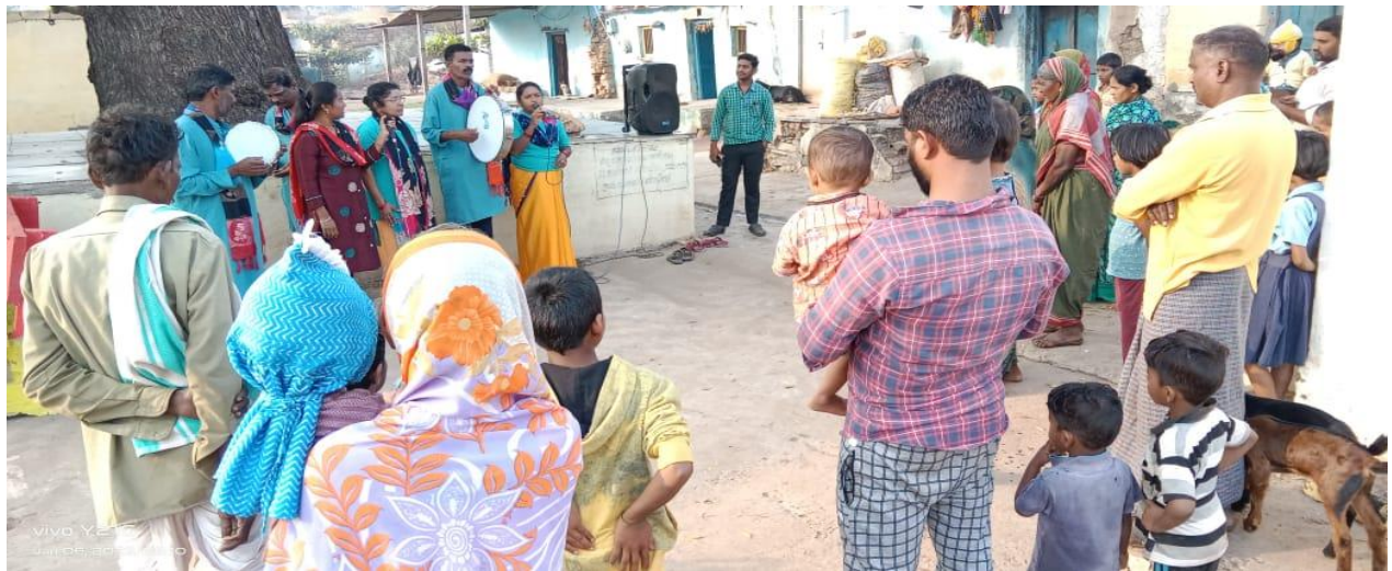
Street Play @ Devanal, Bagalkot on 06.01.2023