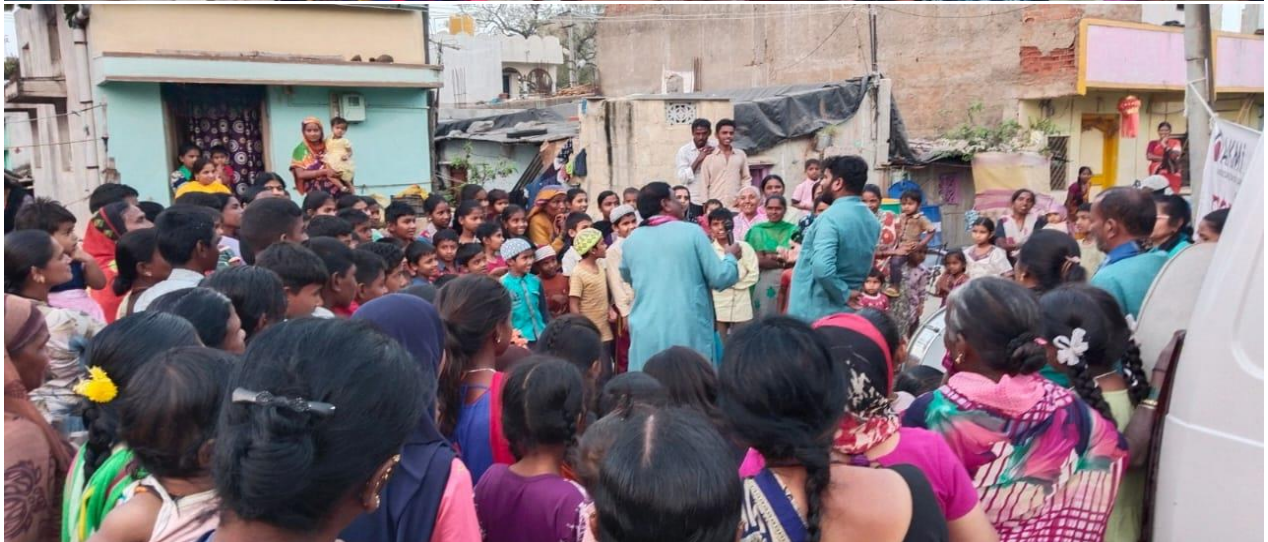
Street play @ Kanththota, Gadag on 21.01.2023