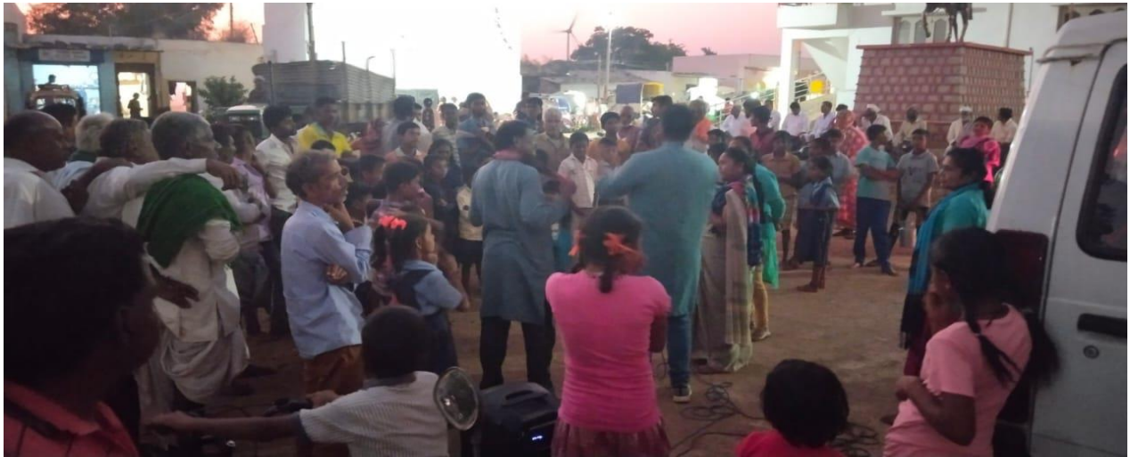
Street Play @ Harthi, Gadag on 23.01.2023