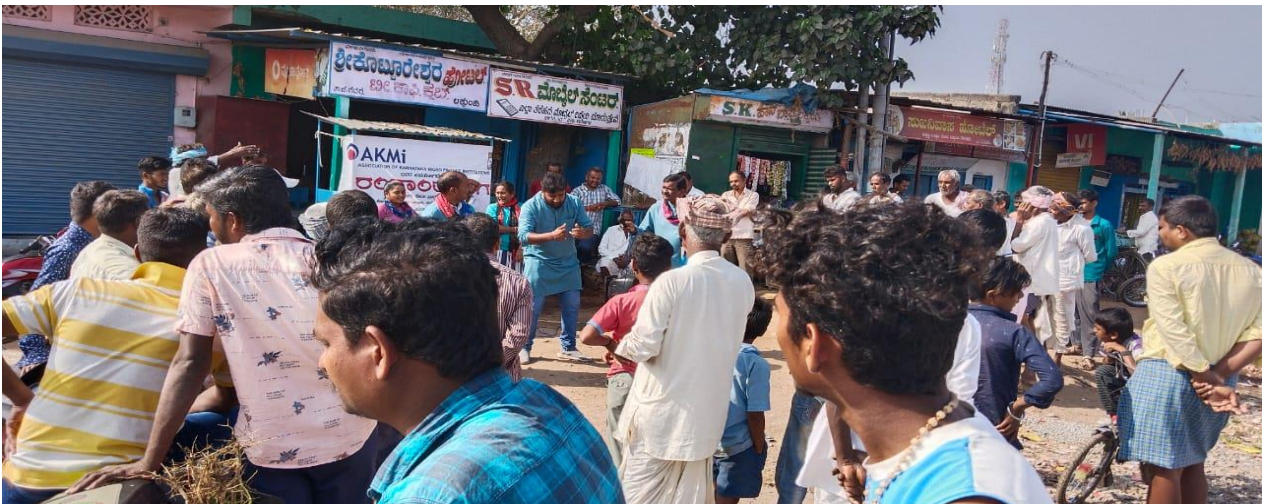
Street Play @ Lakkundi, Gadag on 25.01.2023