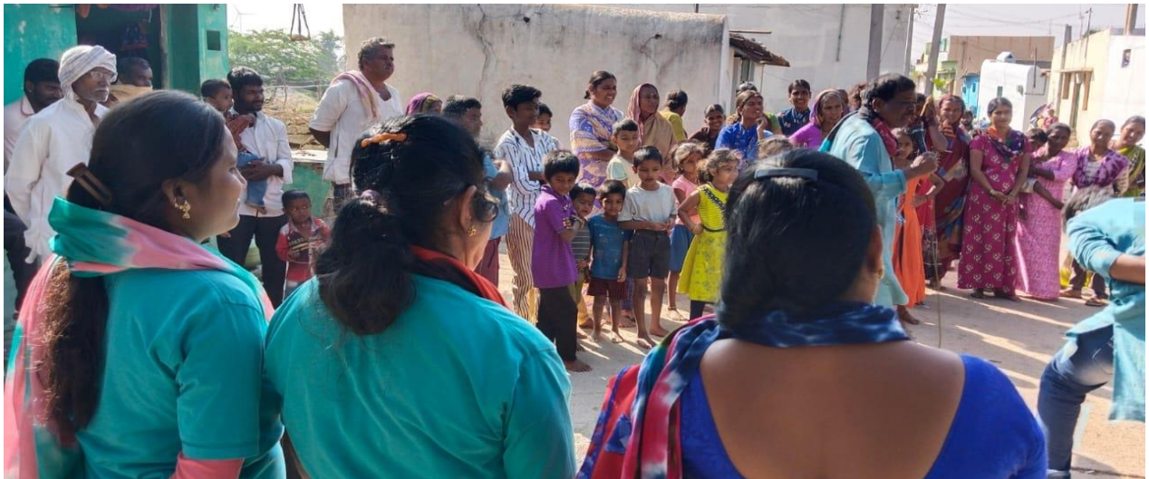
Street Play @ Mallasandra plat, Gadag on 27.01.2023