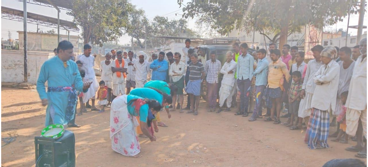
Street Play @ Haradatti, Guledagudda, Bagalkot on 12.01.2023