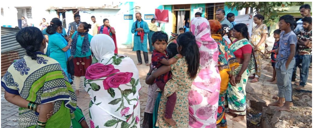
Street Play @ Rehamath Nagar, Gadag on 24.01.2023