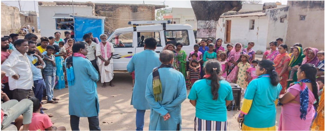
Street Play @ Ambedkar colony, Lakkundi, Gadag on 26.01.2023