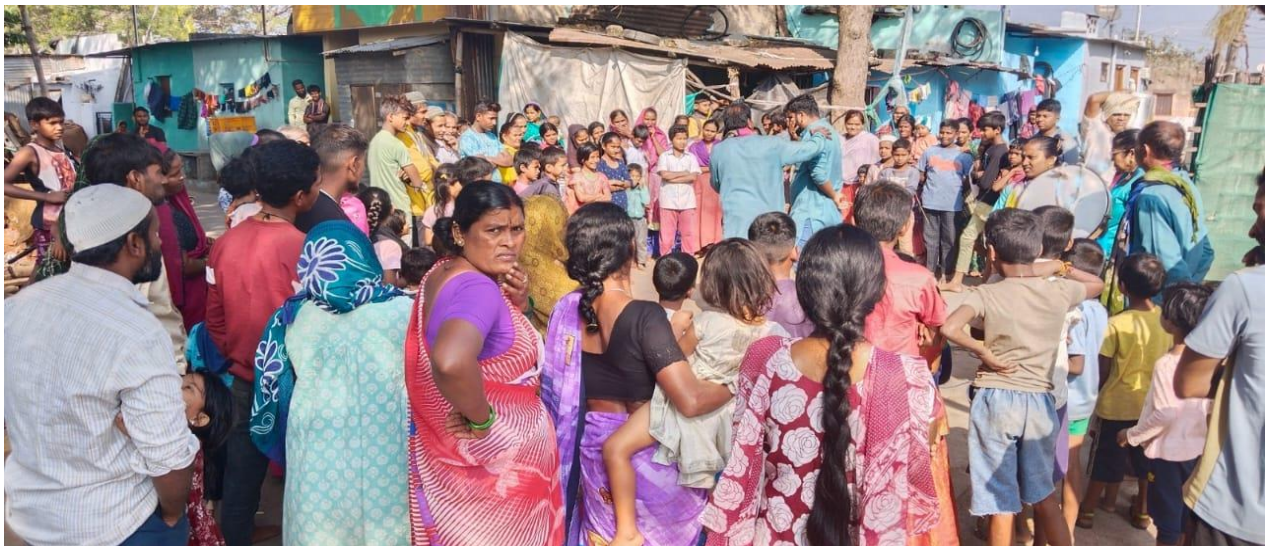
Street Play @ Betageri, Gadag on 22.01.2023