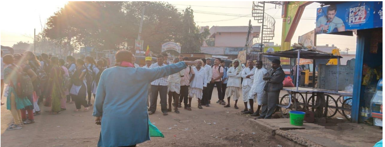
Street Play @ Shirur, Badami Tq, Bagalkote on 14-01-2023