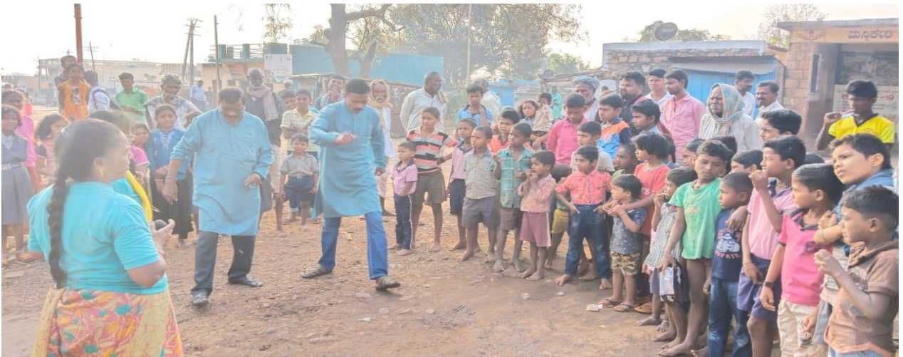
Street Play @ Mannikeri, Bilagi Tq, Bagalkot on 04.01.2023