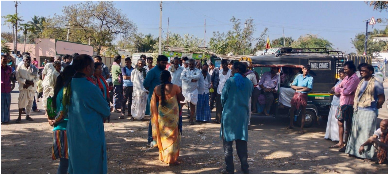
Street Play @ Meundi, Gadag on 28.01.2023