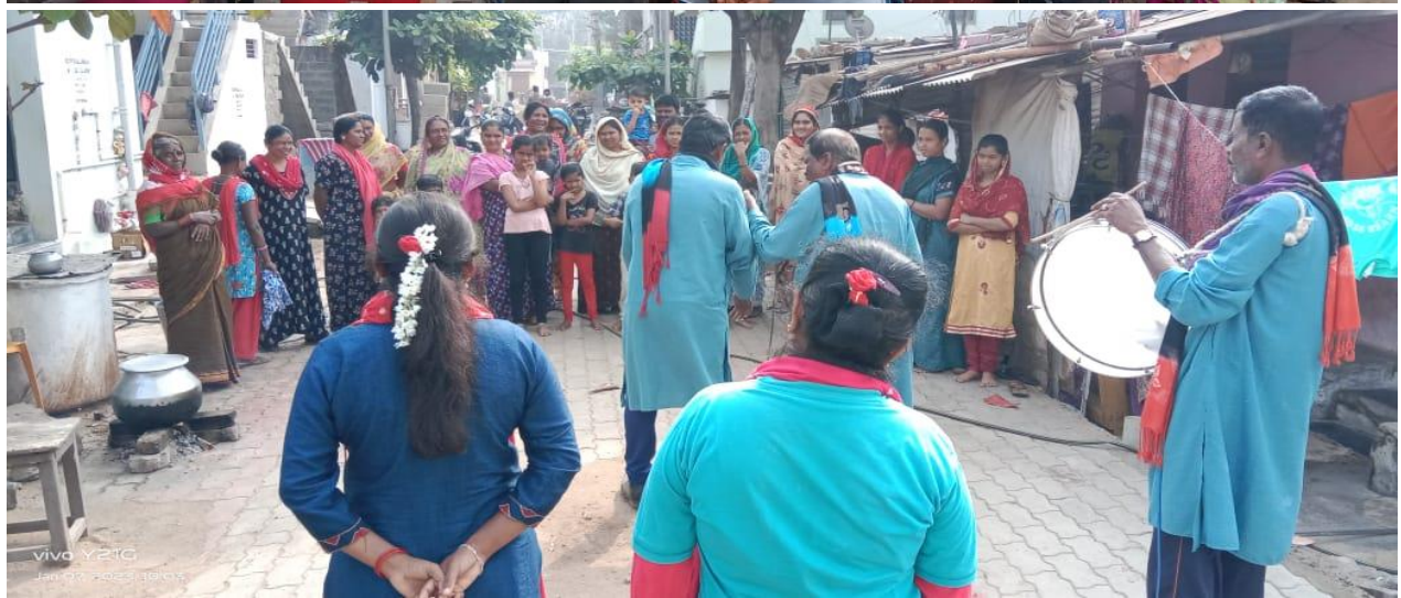
Street Play @ Vasavi Talkies, Bagalkot on 07.01.2023