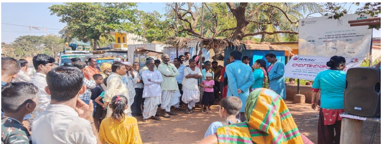
Street Play @ Halakurki, Badami Tq, Bagalkot on 10.01.2023