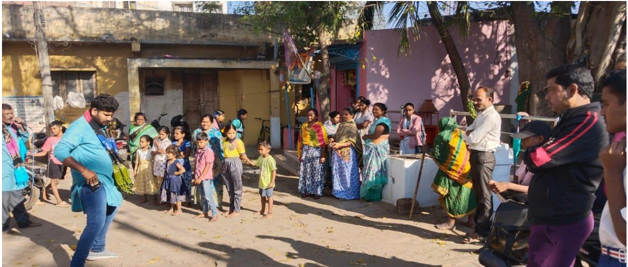
Street Play @ D.C Mill Gadag on 18-01-2023