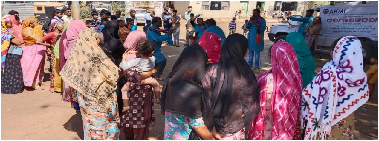
Street Play @ Shahinsha wali Dargah, Bagalkot on 09.01.2023