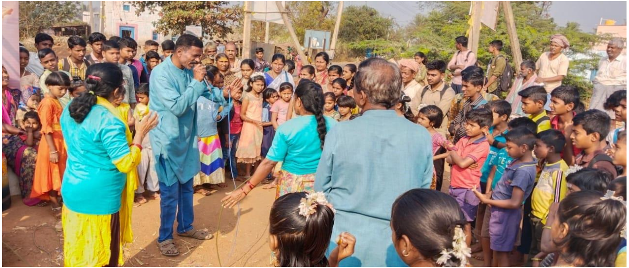
Street Play @ Sunaga, Bilagi Tq, Bagalkot on 04.01.2023