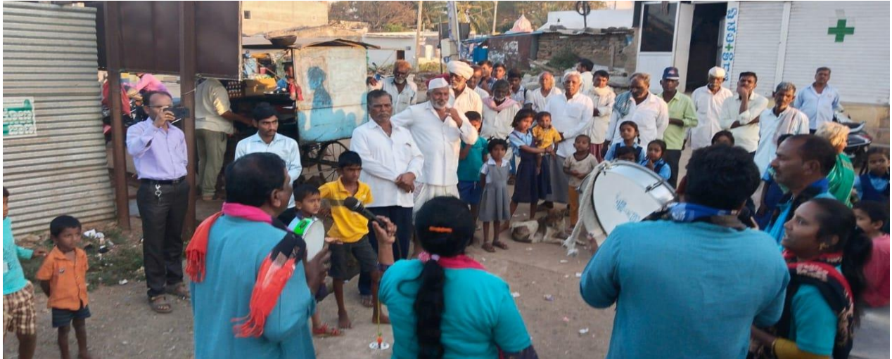
Street Play @ Mallasandra Gadag, on 17-01-2023