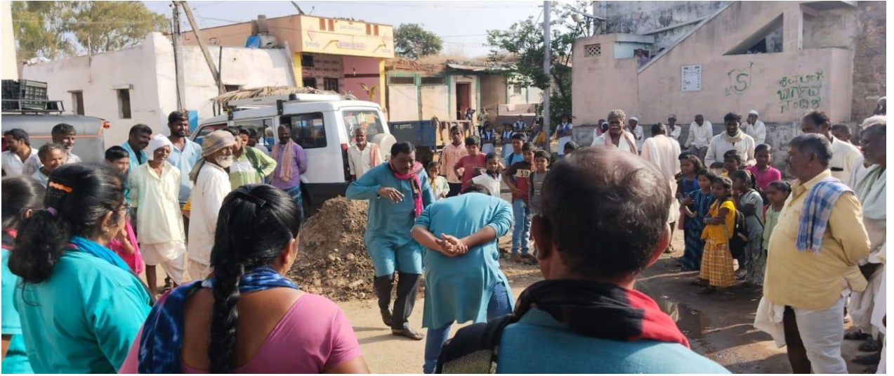
Street Play @ Sambhapura, Gadag on 25.01.2023