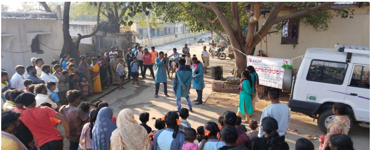
Street Play @ Guledagudda, Bagalkot on 12.01.2023