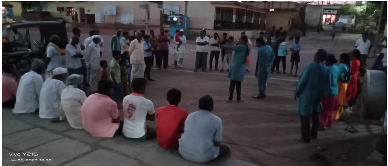
Street Play @ Muchakhandi, Bagalkot on 05.01.2023