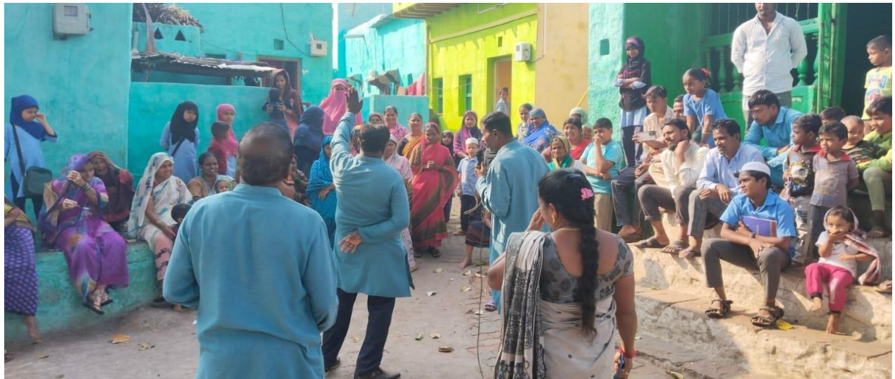
Street Play @ Munnagalli, Bilagi Tq, Bagalkot on 02.01.2023