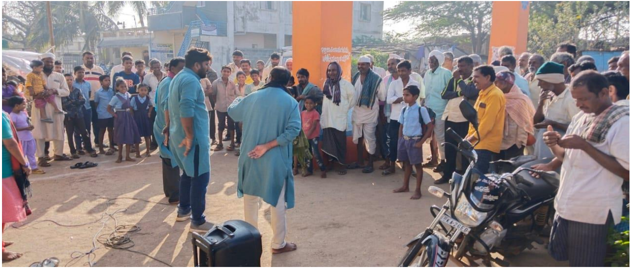
Street Play @ Adavisomapura, Gadag on 27.01.2023