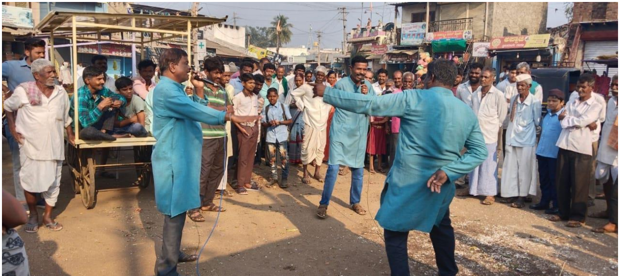
Street play @ Galagali, Bilagi Tq, Bagalkot on 02.01.2023